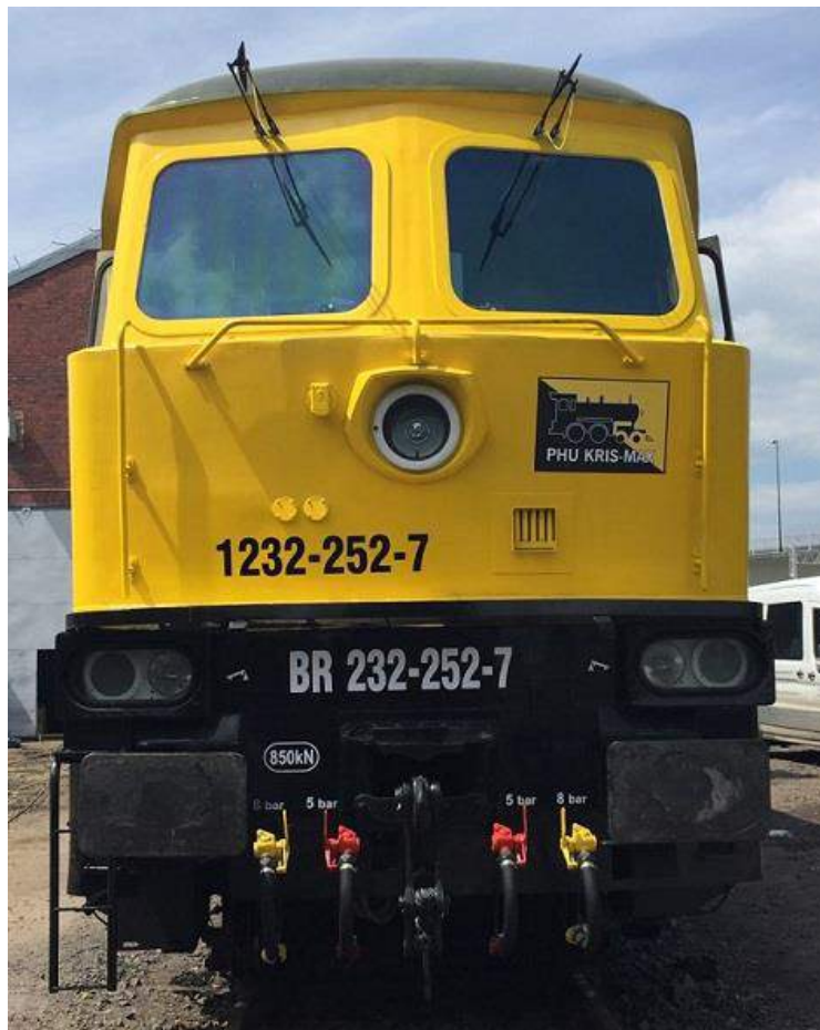
Zdjęcia 2-3 – Reflektory halogenowe firmy Posteor