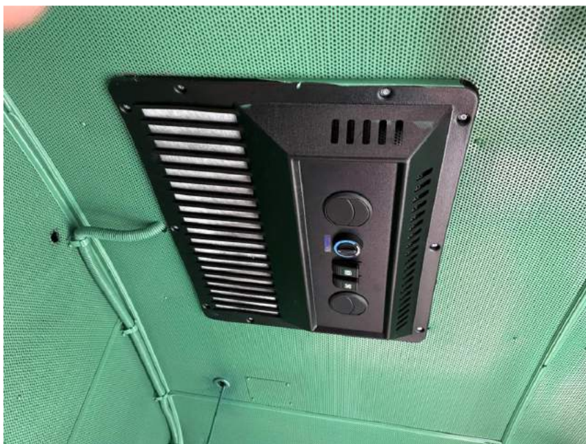
Zdjęcie 1 – Klimatyzacja

Załącznik nr 3 - Zdjęcia podzespołów, w które wyposażone są nasze lokomotywy serii BR231