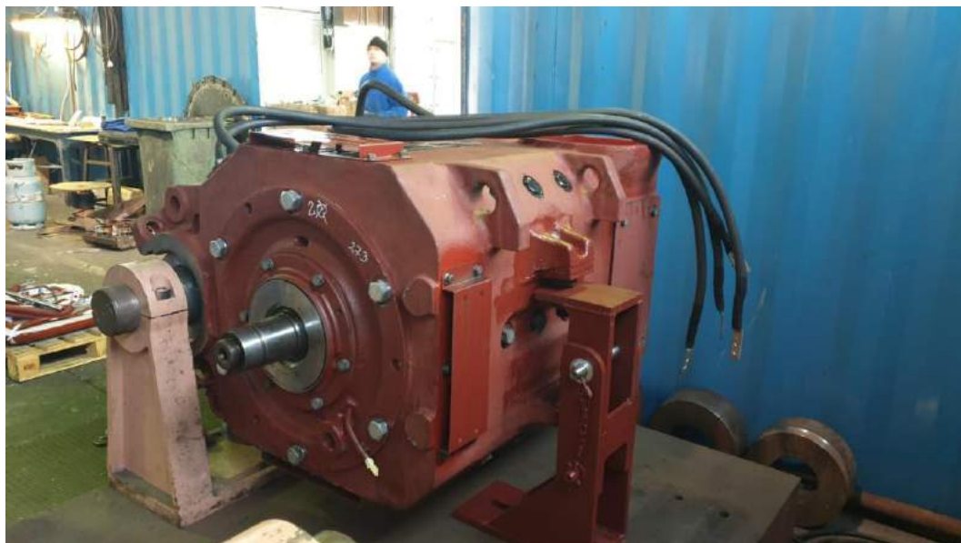
Zdjęcia 6-7 – Silnik ED118 po przeprowadzonym remoncie