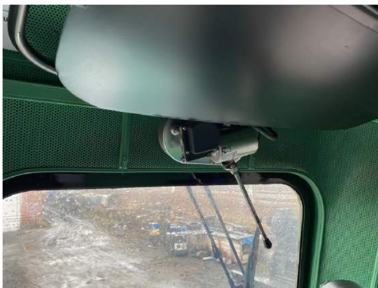
Zdjęcie 4 – Wycieraczki szyb firmy Posteor