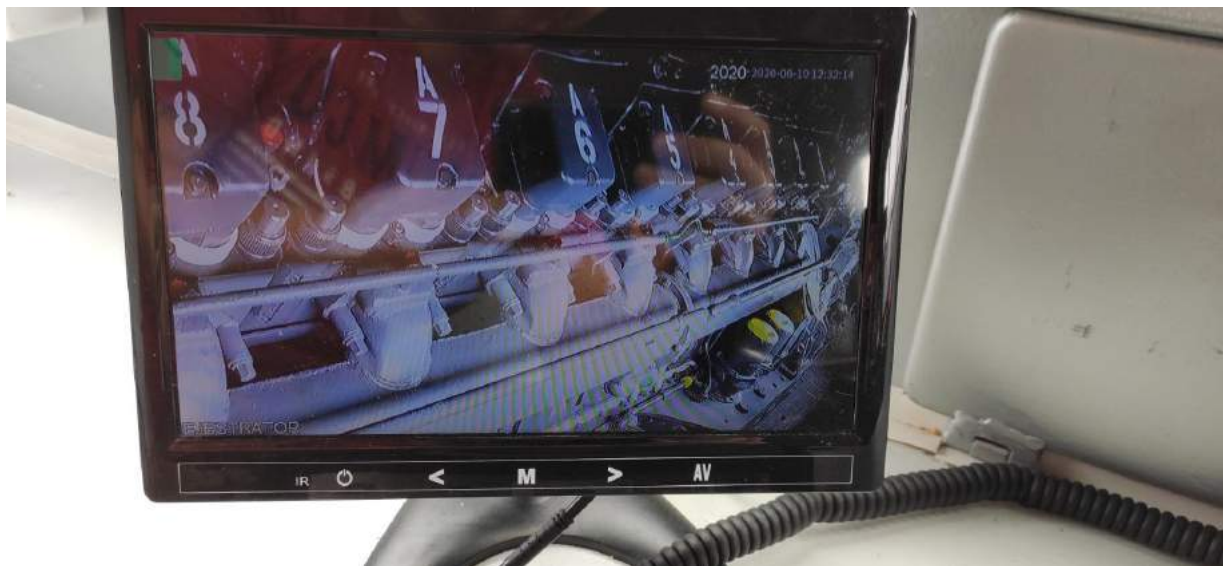
Zdjęcia 10-11 – Zapis z kamer – widok na monitorze znajdującym się wewnątrz kabiny maszynisty