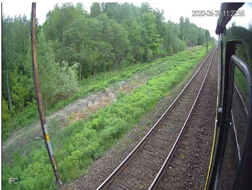
Zdjęcia 12-14 – Widok z kamer lokomotywy