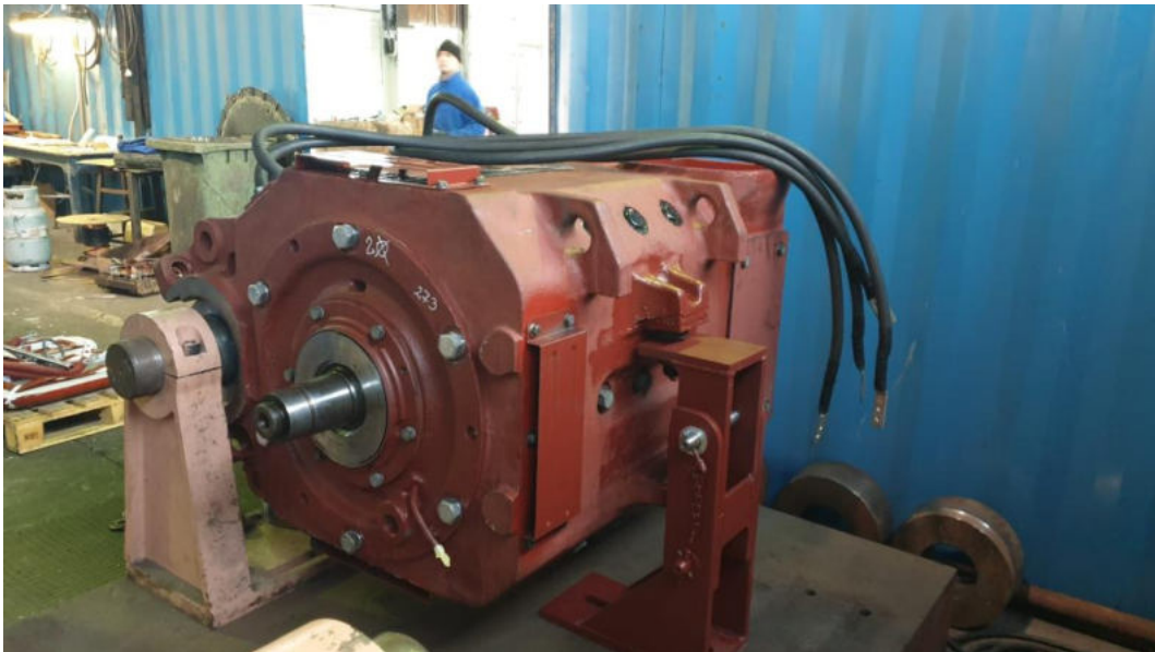
Zdjęcia 6-7 – Silnik ED118 po przeprowadzonym remoncie