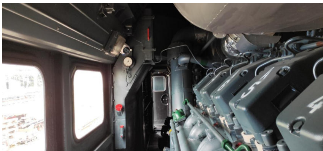
Zdjęcia 8-9 – Kamery IP – monitoring CCTV