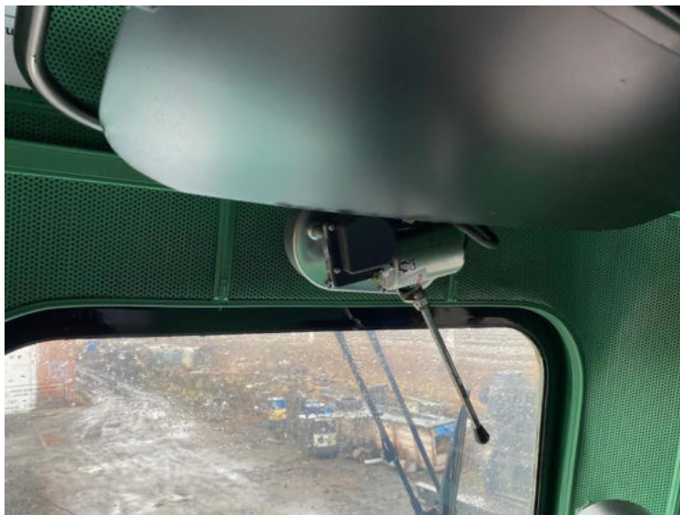
Zdjęcie 4 – Wycieraczki szyb firmy Posteor