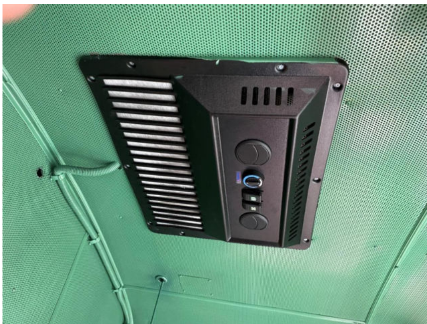
Zdjęcie 1 – Klimatyzacja

Załącznik nr 3 - Zdjęcia podzespołów, w które wyposażone są nasze lokomotywy serii BR231