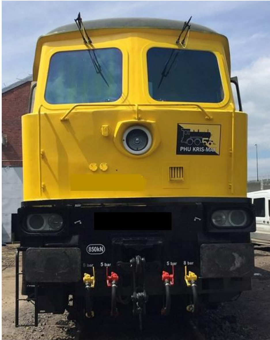
Zdjęcia 2-3 – Reflektory halogenowe firmy Posteor