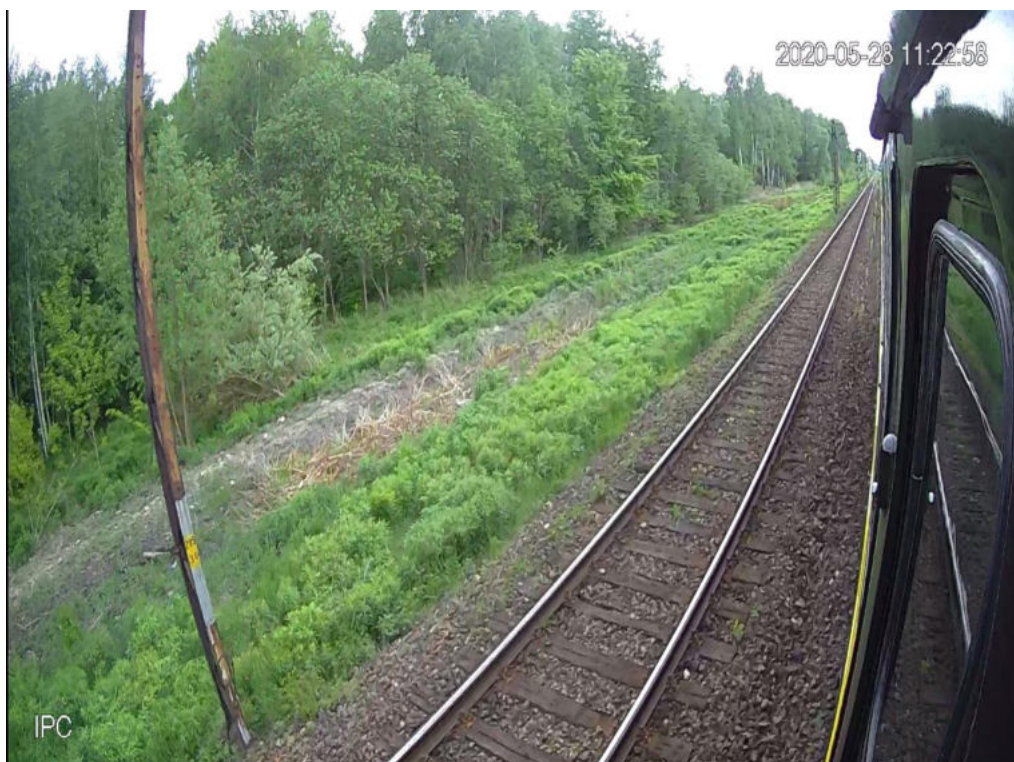
Zdjęcia 12-14 – Widok z kamer lokomotywy

Dodatkowe pytania dotyczące niniejszej oferty handlowej prosimy kierować: