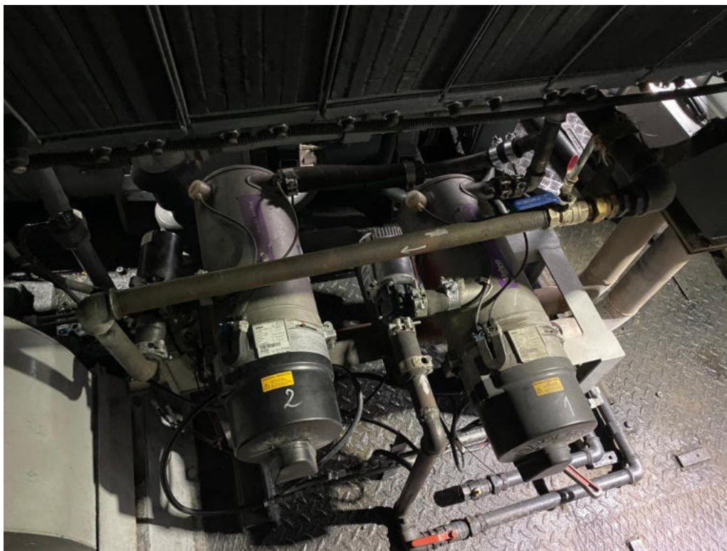
Zdjęcie 5 – Ogrzewanie WEBASTO