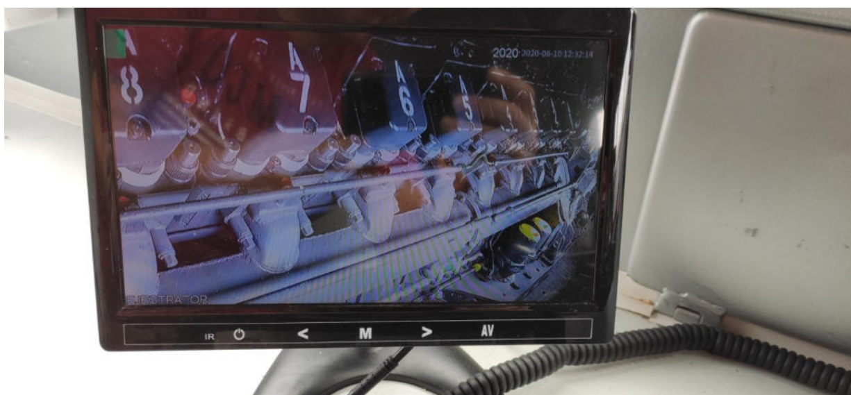
Zdjęcia 10-11 – Zapis z kamer – widok na monitorze znajdującym się wewnątrz kabiny maszynisty